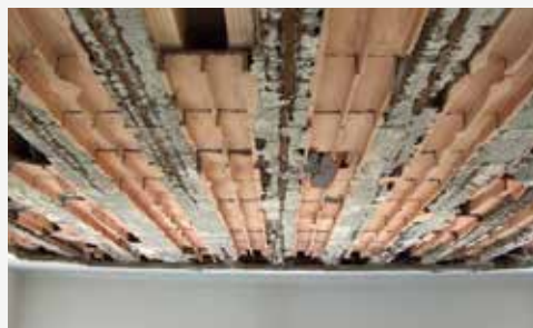
Sfondellamento aula scolastica Rischio fino a 1500 Kg

Il peso dell'intonaco ha una forte incidenza sul peso totale.