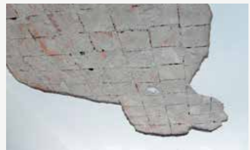
Distacco intonaco aula scolastica Rischio fino a 1000 Kg