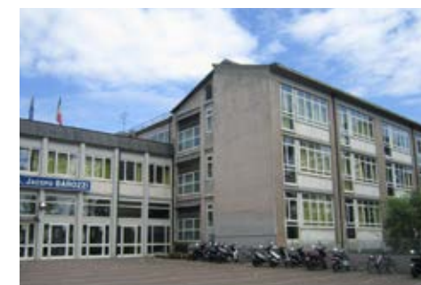
Scuole Provincia di Modena

Per ricevere maggiori informazioni o per fissare un appuntamento con il tuo tecnico-commerciale di zona, contattaci senza impegno.