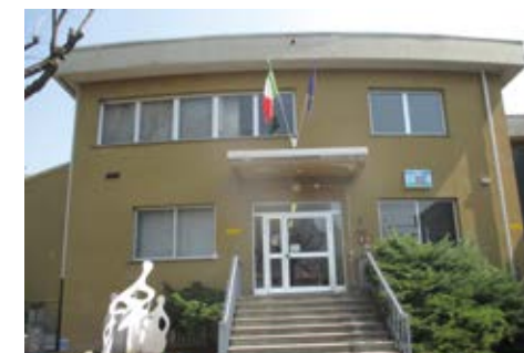
Scuole Comune di Lecco