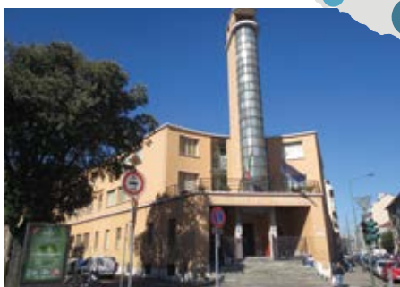
Scuole Provincia di Torino