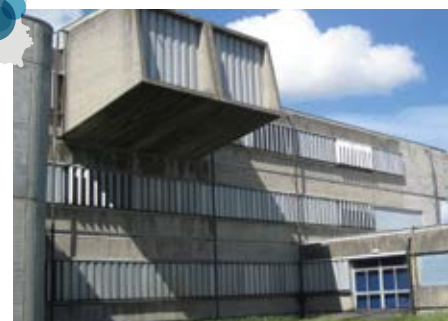
Scuole Provincia di Lucca