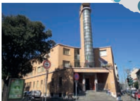
Scuole Provincia di Torino