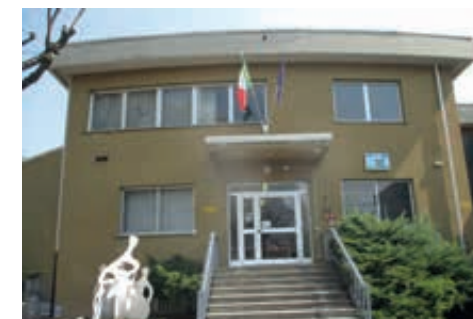
Scuole Comune di Lecco