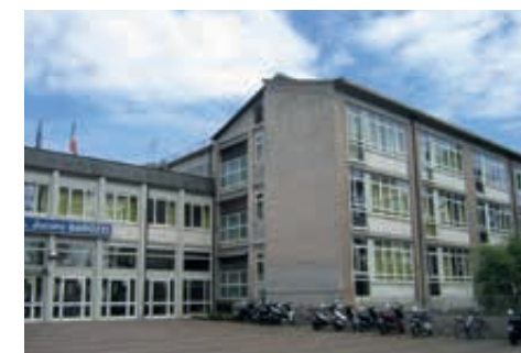
Scuole Provincia di Modena

Per ricevere maggiori informazioni o per fissare un appuntamento con il tuo tecnico-commerciale di zona, contattaci senza impegno.