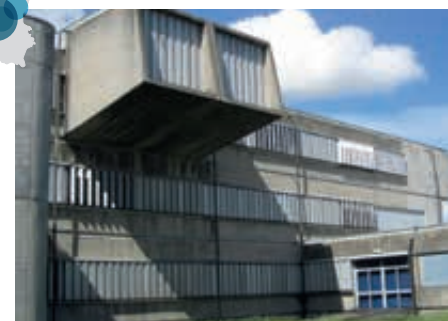
Scuole Provincia di Lucca