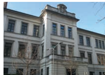
Scuole Comune di Milano

Via Monte Sabotino 14, 20095 Cusano Milanino (MI) | Tel. 02 66302799 | Fax 02 66304937